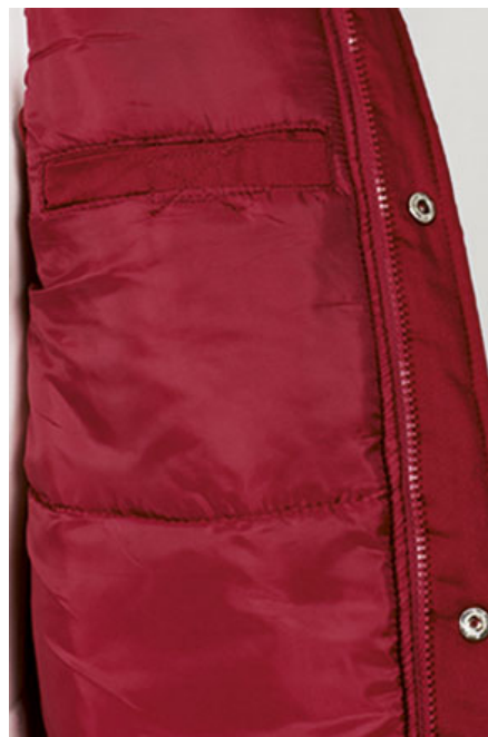
Vista lateral: espalda más larga