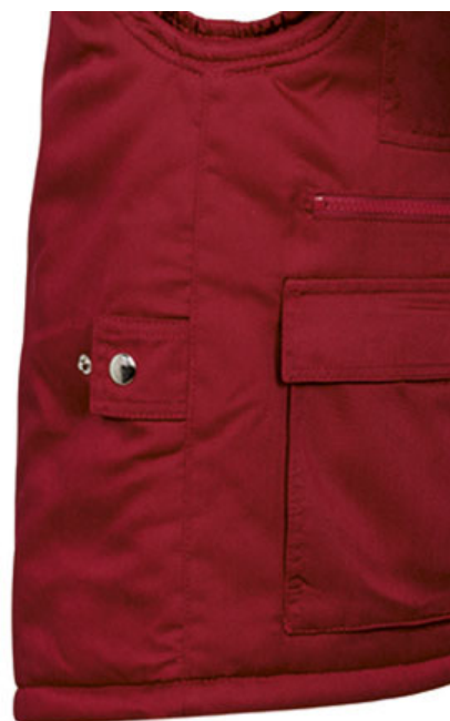
Vista lateral: espalda más larga